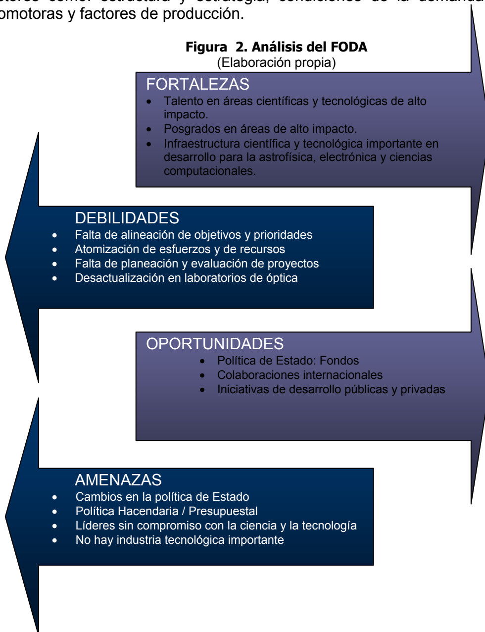
Figura 2. Análisis del FODA (Elaboración propia)

Como todo proceso de planeación, el Programa comienza con un diagnóstico institucional. Se utilizaron dos herramientas de análisis estratégico: la herramienta conocida como del “FODA” (Fuerzas, Oportunidades, Debilidades y Amenazas), la cual sirve para identificar aquellos factores positivos y negativos, internos y externos que afectan las actividades del INAOE, y el “Diamante de Porter”, con el que se hace un análisis de la posición competitiva del instituto, partiendo de factores como: estructura y estrategia, condiciones de la demanda, industrias promotoras y factores de producción.